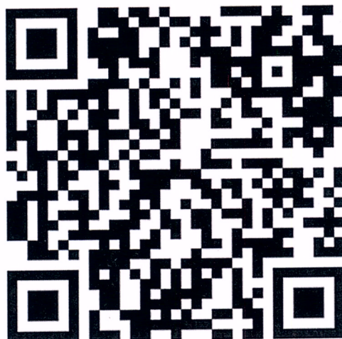
График мероприятий размещен на сайте: https://webinars-rmanpo.ru/ .